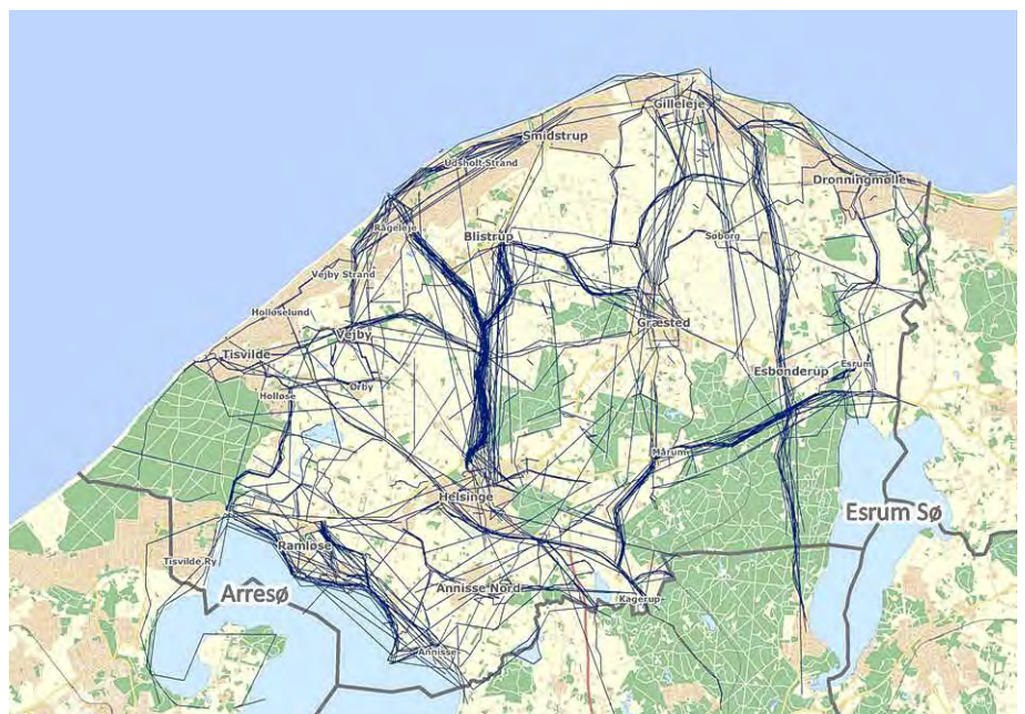
Figur 1. Eksempel på brugernes rå udpegninger samlet på ét kort.

Kendskab til internetundersøgelsen blev udbredt vha. Gribskov Kommunes Facebook side, Ugeposten Gribskov, skolenes intranet, kommunens hjemmeside