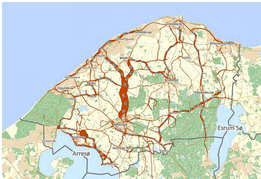
Figur 2. Eksempel på udpegede stier aggregeret til hovedlinjer på kort vha. programmering i GIS (tykkelsen af linjerne illustrerer antallet af udpegninger).

Med baggrund i kommunens kendskab til lokalområdet og henvendelser fra borgere var der behov for i GIS at supplere med en fiktiv stiforbindelse langs Arresø, som rådataene kunne hæfte sig på. Det var med til at give et mere retvisende billede af stionskerne.