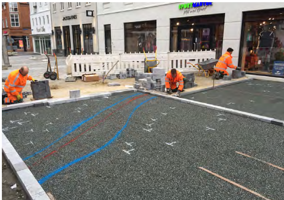
Figur 1. Entreprenørens spraylinjer.

De særlige linjer i granitbelægningen af-sættes digitalt og sprayes på afretningslaget, som brolæggerne kan lægge mønstret efter. Både afretningslaget og det ubundne bærelag er granit (Norit), som sejles til Esbjerg fra Norge.