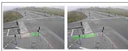
Figur 2. Opstilling af detektor i RUBA for spolefeltet (til venstre) og uden for spolefeltet (til højre) i projektkrydset Paludan-Müllers Vej/Agro Food Park/Tyge Søndergaards Vej.

I de foretagne RUBA-analyser skelnes mellem to arealer i hvert af de undersøgte hjørner. Det ene er arealet i selve spolefeltet, hvilket anses for den korrekte placering af cyklisten, da placeringen medfører anmeldelsen af cyklisten i anlægget. Det andet er arealet uden for spolefeltet. Det vil sige arealet nær spolen, ved siden af spolen, bag stoplinjen eller tæt på fortovs-kanten. På figur 2 er arealerne i og uden for spolefeltet illustreret for krydset mellem Paludan-Müllers Vej, Agro Food Park og Tyge Søndergaards Vej.