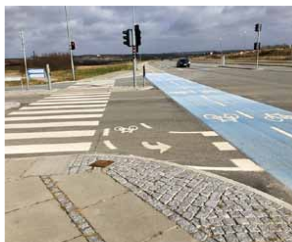
Figur 1. Venstresvingsboks i krydset Paludan-Müllers Vej/Agro Food Park/Tyge Søndergaards Vej i Skejby, Aarhus.

Cyklister, som ikke placerer sig korrekt over de nedfræsede spoler, vil ikke få grønt til at fortsætte over krydset, før en anden cyklist eller knallertfører placerer sig over spolen til den samme fase, eller hvis det gøres manuelt på fodgængernes tryknap. Manglende eller forsinket grønt lys betyder unødvendigt lange ventetider for de venstresvingende cyklister, og dermed bliver det mindre attraktivt at cykle.